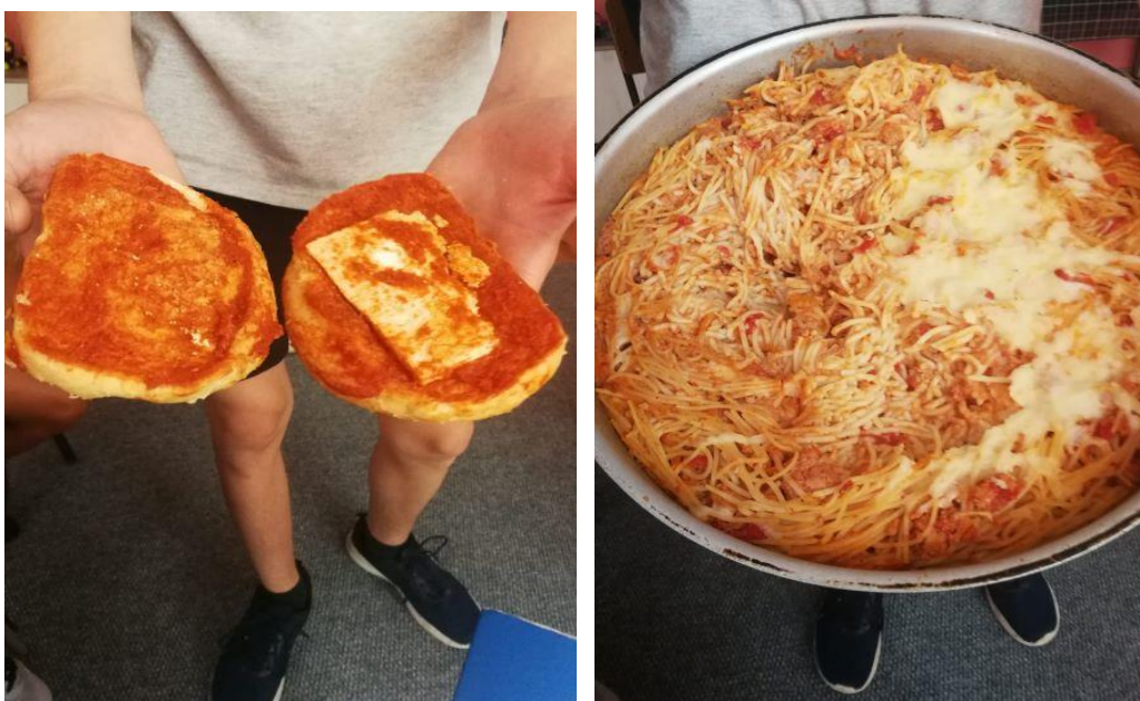
Сутрешната закуска и изстиналата вечеря, приготвена от предния ден

- според децата няма достатъчно дарители, като причината за това е отношението на директорката към тях. Те разказаха, че тя е много мнителна и затова не иска да работи с дарители. Последната публична дарителска кампания, която е била организирана, е в края на 2021 г., когато са събирани зимни дрехи и обувки.